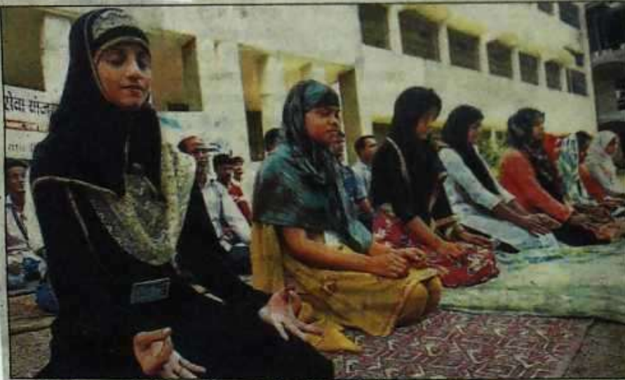
पटना सिटी में लगाए गए योग शिविर में मुस्लिम युवतियों की भी रही भागीदारी।