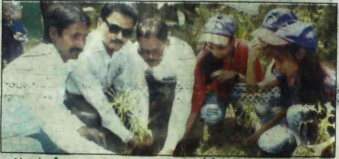
اورینٹل کالج پٹنہ میں یوم عالمی ماحولیات کے موقع پر شجرکاری کرتے طالبات و اساتذہ