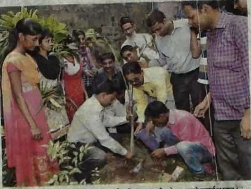
ओरिएंटल कॉलेज में विश्व पर्यावरण दिवस की पूर्व संध्या पर पौधरोपण करते प्रचार्य व छात्र।